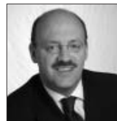
par Didier Donfut

Secrétaire d'État aux Affaires européennes