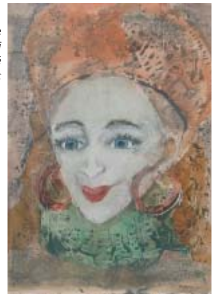
Portrait de ma mère Une des œuvres qui a beaucoup marqué le nombreux public