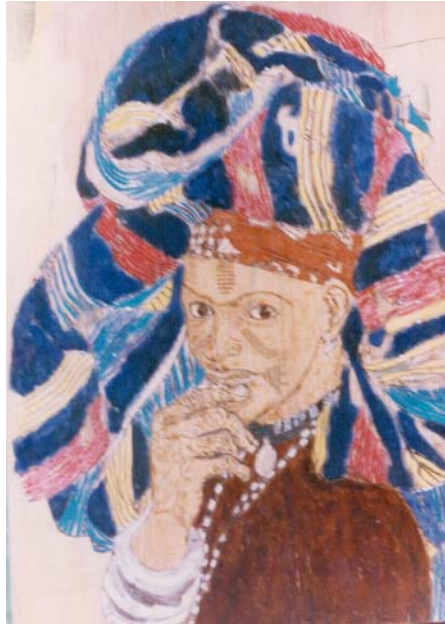
Femme au foulard Pyrogravure et peinture Ali Coulibaly (Niger)