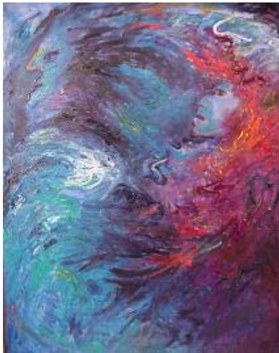
Neptuno y Pluton Huile sur lin Leonor Villagra (Perou)