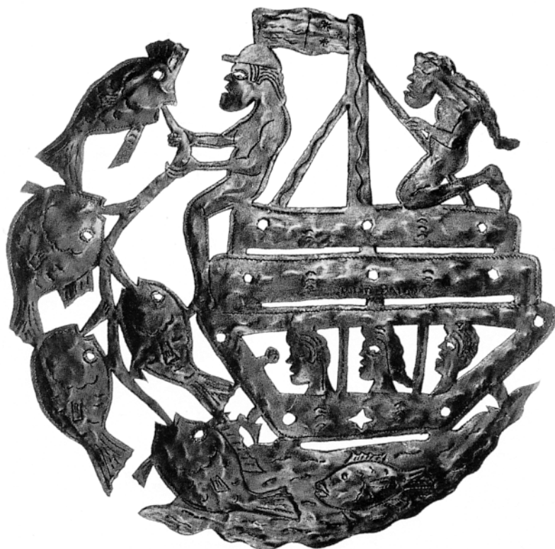
Pêche en mer Sculpture – Les forgerons du Vódou Julio Balan (Haïti)