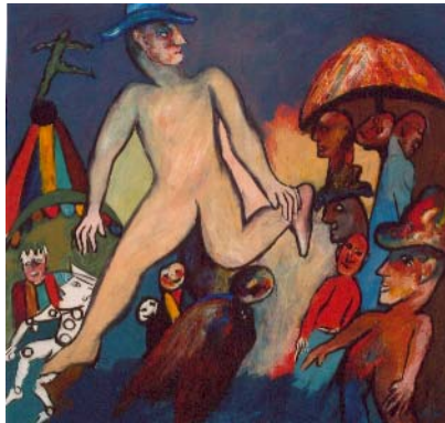
Sombrero azul Huile sur toile De Victor Barros (Equateur)